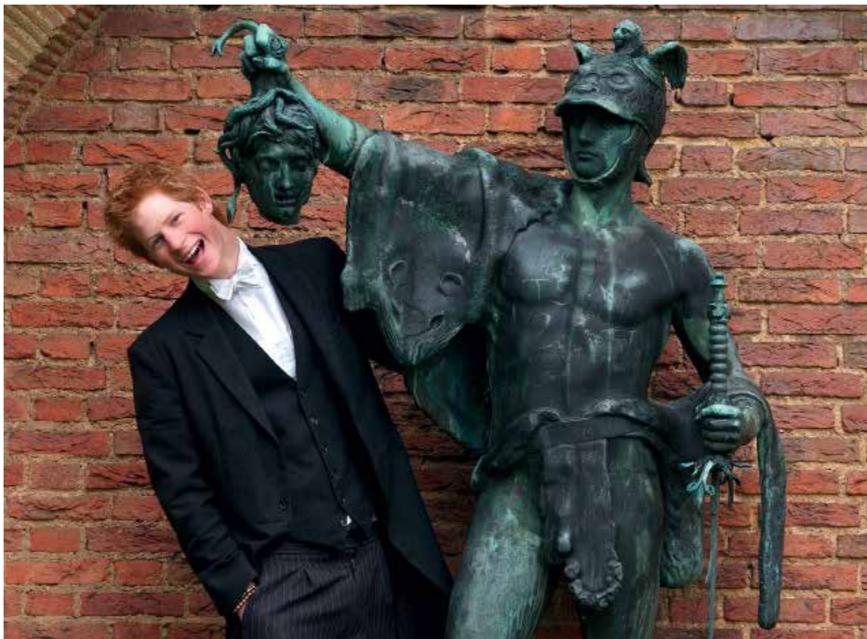
Факт. Принц Гарри позирует у статуи Персея в Итонском колледже.